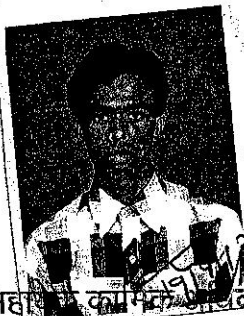
सहायक प्रबन्धक (का.) पूर्वात्तर रेलवे, वाराणसी