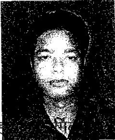
सह संचालक पूवात्तर रेलवे, वाराणसी

उक्त पर सक्षम अधिकारी का अनुमोदन प्राप्त है ।